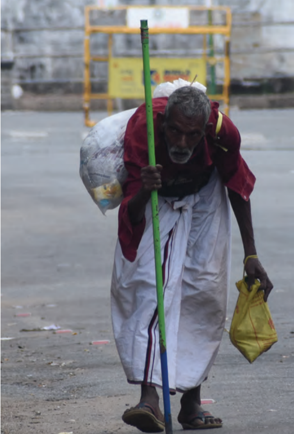
നമ്മുനിയൊടെ തെരുവിന്റെ മകൾ..

കോഴിക്കോട്: കൊവിഡ് രോഗികൾക്ക് ഓക്സിജൻ ലഭ്യത ഉറപ്പാക്കാനായി തദ്ദേശ സ്വയംഭരണ സ്ഥാപനങ്ങൾ ഓക്സിജൻ കോൺസൻട്രേറ്ററുകൾ വാങ്ങാൻ തീരുമാനിച്ചിട്ടുള്ളതായി ജില്ലാ കലക്ടർ അറിയിച്ചു.